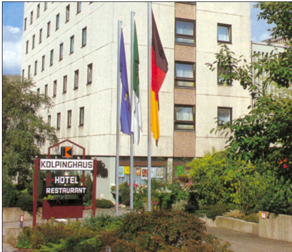
Das Kolpinghaus Fulda, unser Tagungsort

Die zweimal jährlich stattfindenden Tagungen des VTF bieten Gelegenheit zum persönlichen Kennenlernen, zum Erfahrungsaustausch und zur Horizonterweiterung. Der Schwerpunkt bei der im Frühjahr stattfindenden, 2½-tägigen Jahrestagung liegt bei Fachvorträgen mit internen und externen Referenten zu Themen aus dem Bereich der Transkommunikation und anderen Grenzgebieten der Wissenschaft, während bei der 1½-tägigen Herbsttagung der Schwerpunkt bei praktischer Hilfestellung und der Vorstellung experimenteller Entwicklungen aus dem Bereich der Transkommunikation liegt. Zwischen den offiziellen Programmpunkten gibt es immer auch viel Raum für Gespräche und Einspielungen.